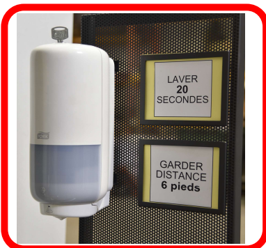
DISTRIBUTRICE À SAVON TOUCHLESS