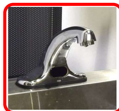
ROBINET AVEC SENSEUR TOUCHLESS